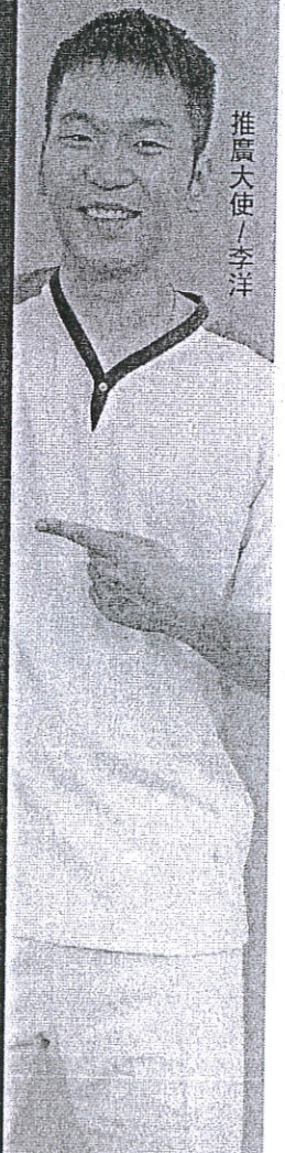
推廣大使 / 李洋